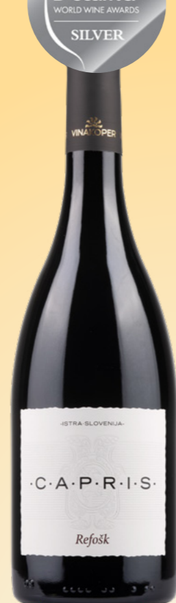
PLATINUM VINISTRA IN SREBRNA DECANTER Capris Refošk 2020