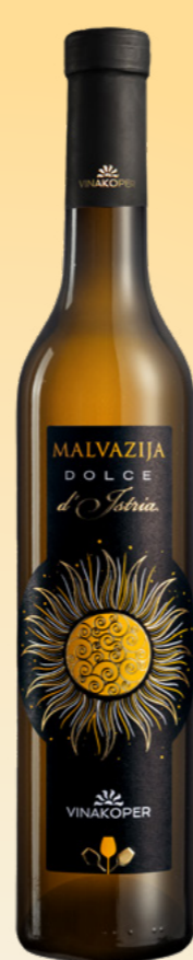
ZLATA MEDALJA THE WORLD OF MALVASIA 2023 Dolce d'Istria Malvazija 2015